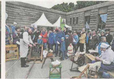
Wasserbeckenbefüllung 2017, Sommerfest 2016, Übergabe des Stifterzimmers 2014, Bürgerfest 2013