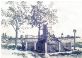
Kugeldenkmal bei Möckern nach 1850

Die Einweihung des Möckernen Kugeldenkmals fand am 3. Juni 1850 nördlich des Ortes in einem Feld nahe der Eisenbahnstrecke am Wege nach Groß-Wiederitzsch statt. Laut Gründungsurkunde erfolgte von hier aus die Erstürmung der Stellung einer französischen Batterie. Zum leichteren Auffinden wurde es vom Verein bereits 1858 an den westlichen Dorfausgang von Möckern, an die Chaussee nach Halle (heute Georg-Schumann-/Slevogtstraße) umgesetzt. Da nach 1900 dieses Areal zur Bebauung vorgesehen war, musste ein erneuter Standortwechsel erfolgen. Am 9. Oktober 1903 war die Umsetzung in die Anlagen vor der 1901 errichteten Auferstehungskirche abgeschlossen. Nachdem viele Jahrzehnte hindurch die dem Denkmal den Namen gebenden Kugeln unberührt blieben, wurden sie bis