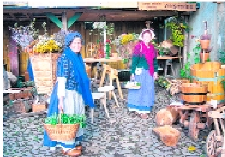
Eine Reise in die Vergangenheit – mit Engagement gestalten die Liebertwolkwitzer das dörfliche Leben zur Zeit der Völkerschlacht nach Foto: liebDorf – 1813

Eintritt: Fr. frei, Sa./So. 5€ (ermäßigt 3€) Samstagabend: Tanz auf der Tenne mit Zerrwanst & Co. (gesonderter Eintritt)