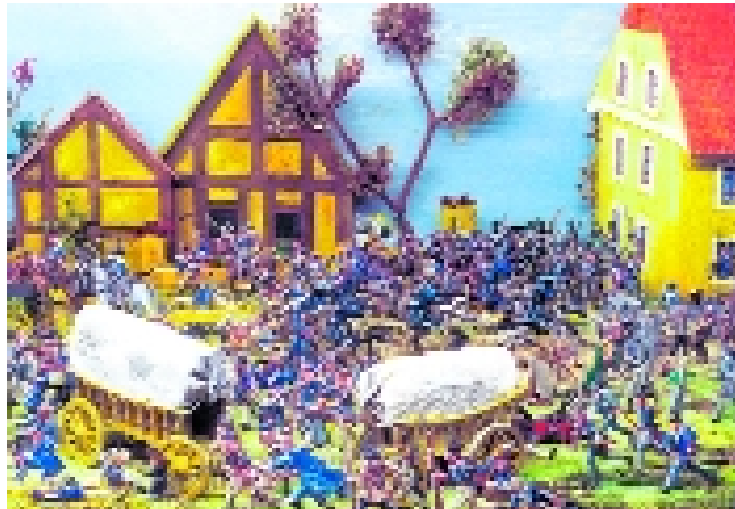
Ausschnitt aus dem Diorama

Das und anderes, wie den „Abschied Napoleons von Leipzig an der Lindenauer Mühle“, können Sie im Torhaus Dölitz erleben, aufgestellt und gestaltet mit Tausenden von Zinnfiguren durch die Zinnfigurenfreunde Leipzig.