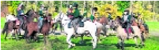
Reitergefecht bei Wachau

Was am 14. Oktober 1813 als kleineres Aufklärungsgefecht begann, sollte sich zur größten Reiterschlacht der napoleonischen Kriege und damit der Neuzeit entwickeln. Die Hauptarmee der verbündeten Preußen, Österreicher und Russen stand der Armee Murats zwischen Liebertwolkwitz und Wachau gegenüber. Genau sieben Jahre lag es zurück, als die Franzosen mit ihren Verbündeten siegreich, nach der Schlacht