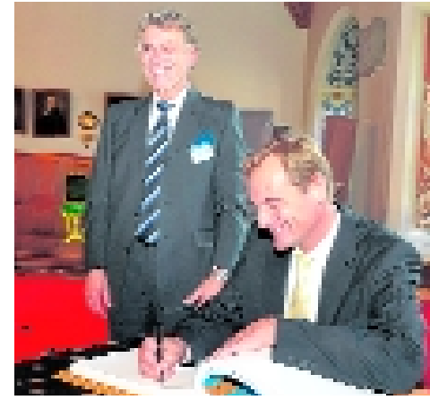
Oberbürgermeister Burkhard Jung beim Eintrag in das Ehrenbuch zur Festveranstaltung des Förderverein am 18. Oktober vorigen Jahres